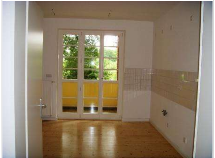
Küche mit Balkon