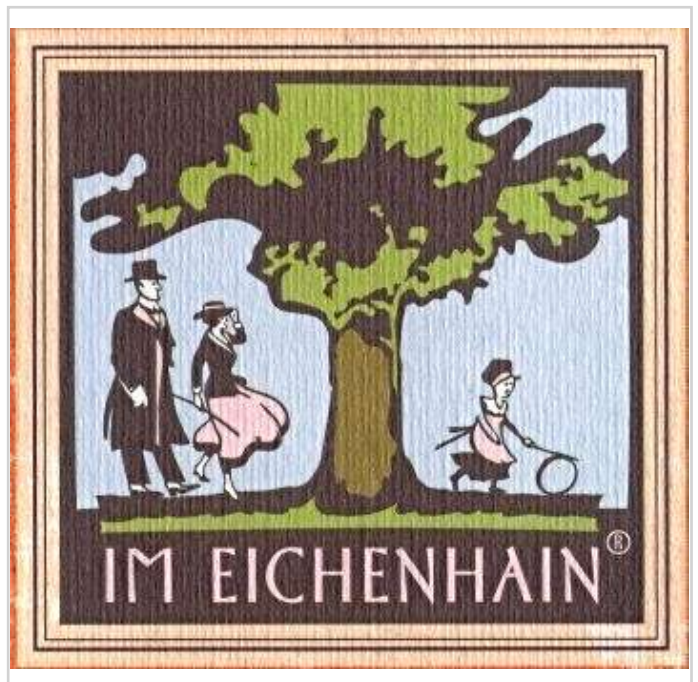
Logo des Hauses